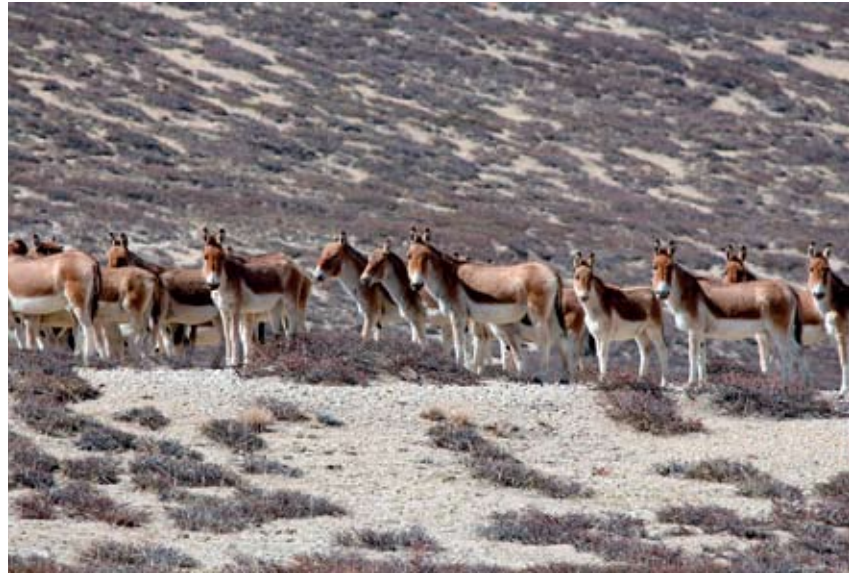
Ngarin alueella käyskenteli villiaasien lauma.