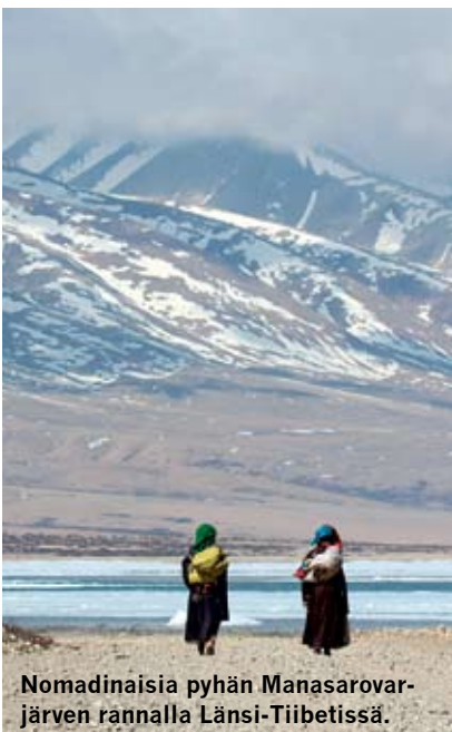
Nomadinaisia pyhän Manasarovar- järven rannalla Länsi-Tiibetissä.