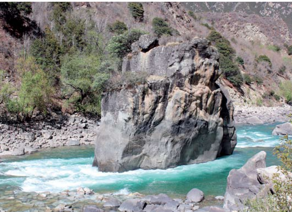
Näytteitä kerättiin muun muassa Lhasajoen sivujoesta matkalla Kongpon alueelle.