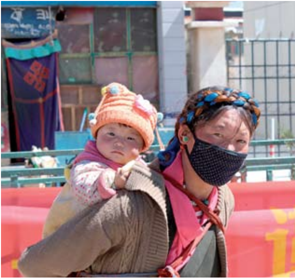
Tiibetin kuiva ja pölyävä maaperä saa etenkin monet naiset käyttämään hengityssuojaimia.