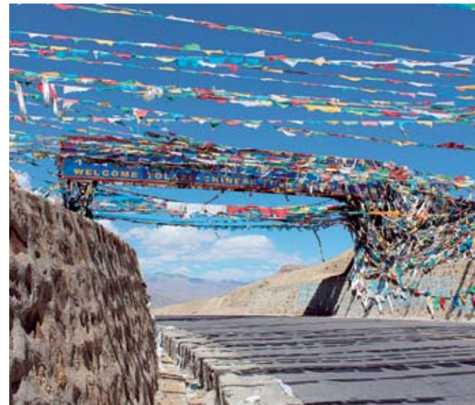
Tiibetiläisiä pidetään maailman uskonnolli- simpana kansana. Lungta-rukouslippuja näkyy erityisesti vuorten huipuilla.