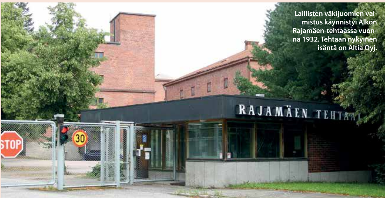
Laillisten väkijuomien valmistus käynnistyi Alkon Rajamäen-tehtaassa vuonna 1932. Tehtaan nykyinen isäntä on Altia Oyj.

Paradoksaalista kyllä, Alko joutui aluksi ostamaan spriitä ja pullotettua viinaa sieltä, mistä salakuljettajakin olivat sitä tuoneet, eli Virosta. Yhtiön ensimmäinen Rajamäen-tehtaassaan valmistama tuote oli Pöytäviina.