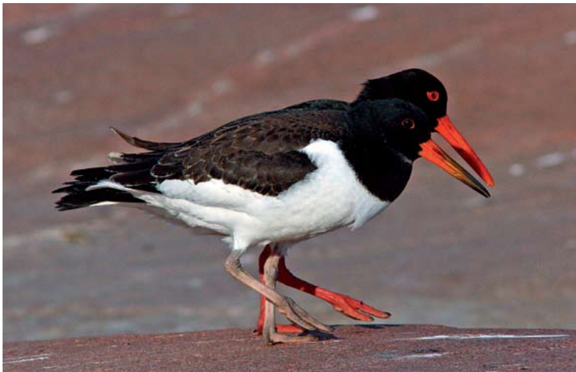
Meriharakan poikanen (edessä) emoineen löytyi kuvaan Hangosta.