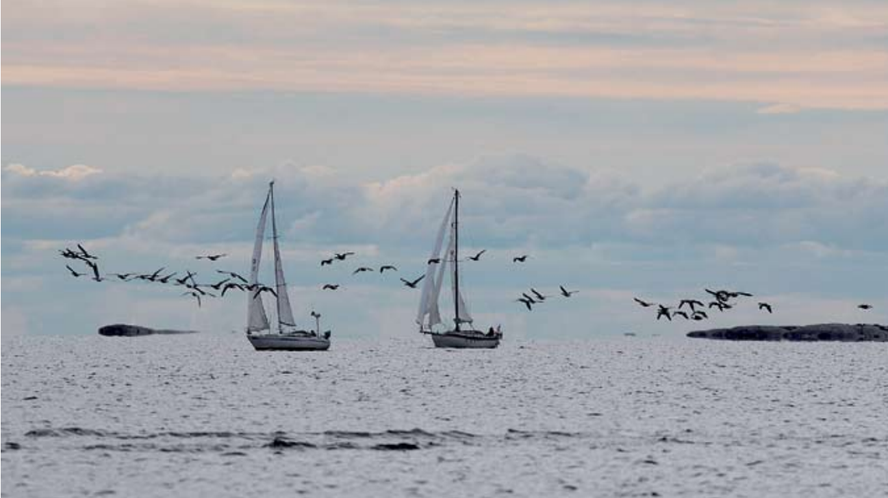
Valkokoskivanhet Saaristomeren taivaalla. Suurikokoinen kuva on esillä Haukilahden paviljongissa.

Aika moni suomalainen on samaa mieltä. Kun mökkiläiset viime vuonna saivat BirdLifen äänestyksessä nimetä suosikkilintunsa, kuikka nousi ylivoimaiseksi ykköseksi.